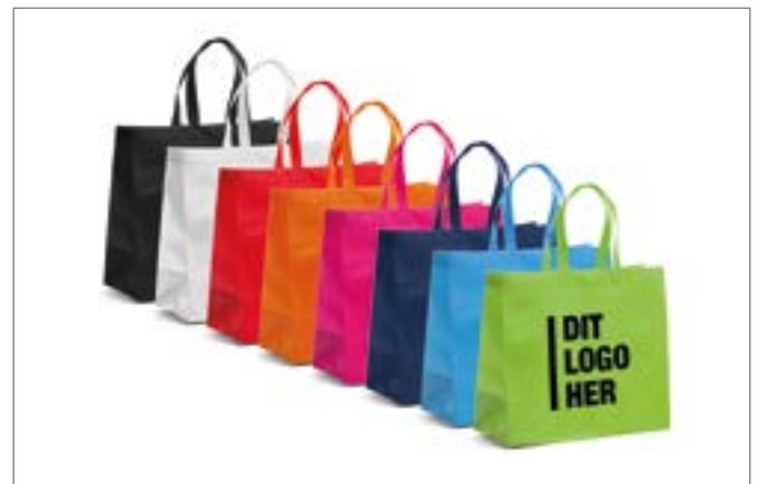
TASKER & MULEPOSER