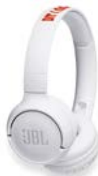
JBL TUNE 500 HØRETELEFON