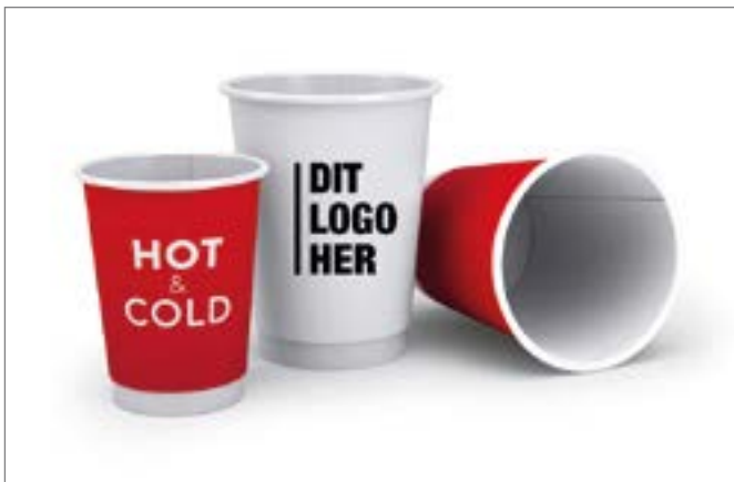
BÆGER & GLAS