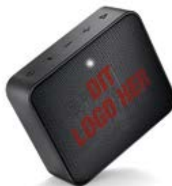
JBL GO 2 HØJTALER